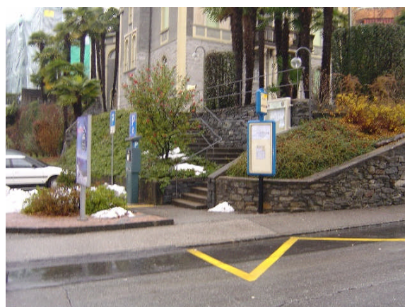
Linea 23, Via Borengo direzione Locarno