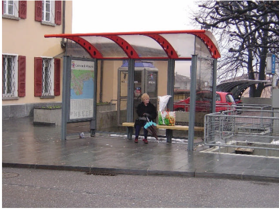
Linea 31, Municipio direzione Tenero