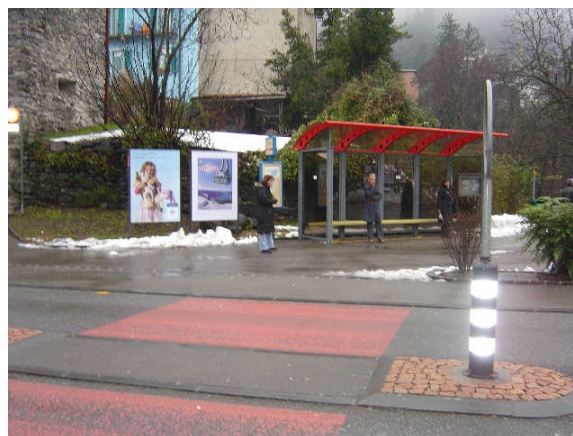
Linea 31, Ponte Navegna direzione Locarno