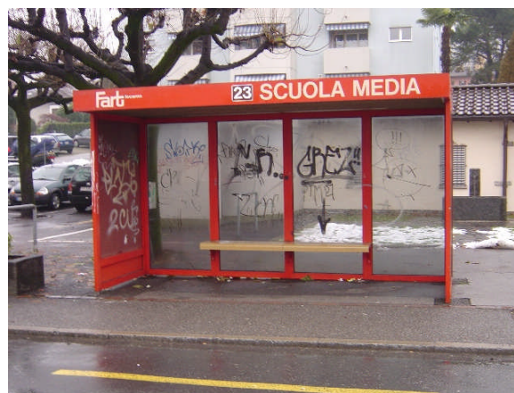
Linea 23, Scuola Media direzione Locarno