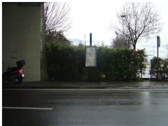
Linea 31, Mappo direzione Tenero