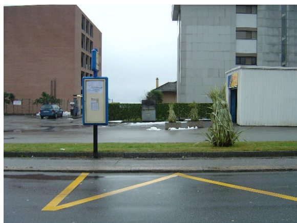
Linea 23, Via Verbano direzione Tenero