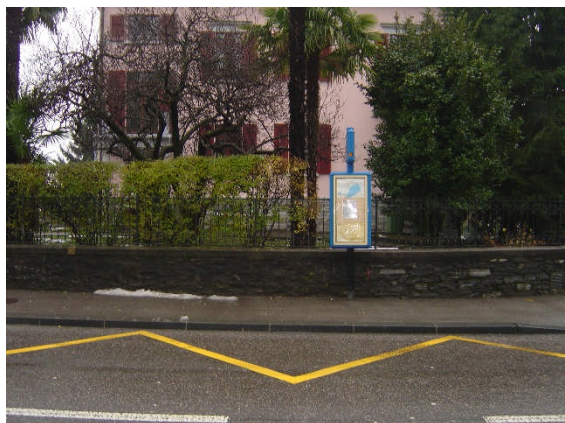
Linea 31, Remorino direzione Tenero