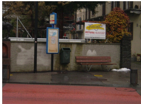
Linea 31, Crocifisso direzione Locarno