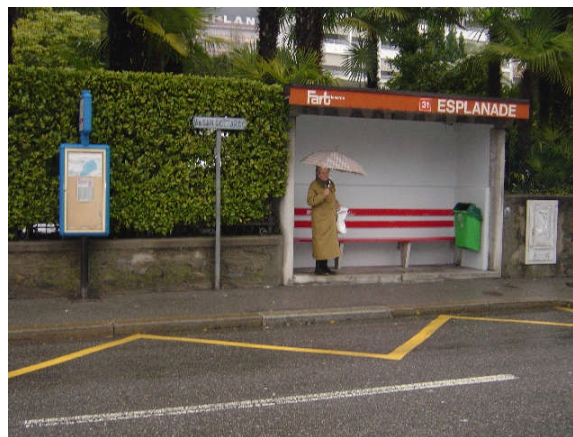
Linea 31, Remorino direzione Locarno