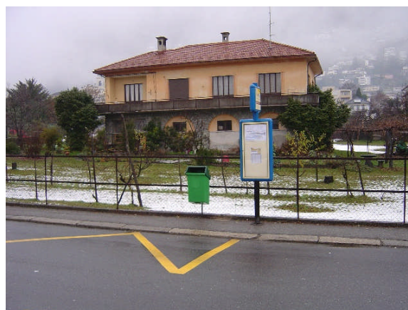
Linea 23, Via Verbano direzione Locarno