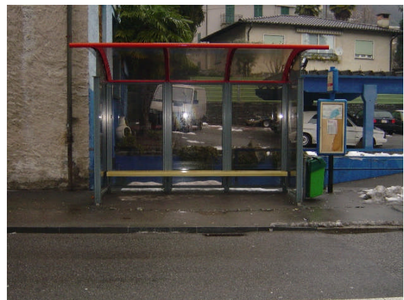
Linea 31, Remorino direzione Locarno