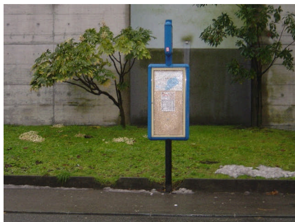
Linea 31, Ponte Navegna direzione Tenero