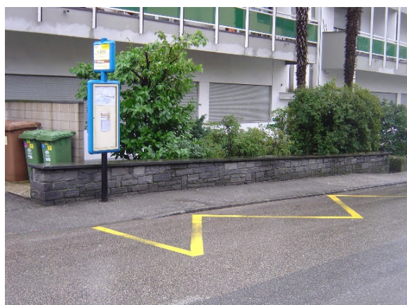
Linea 23, Via Borengo direzione Tenero