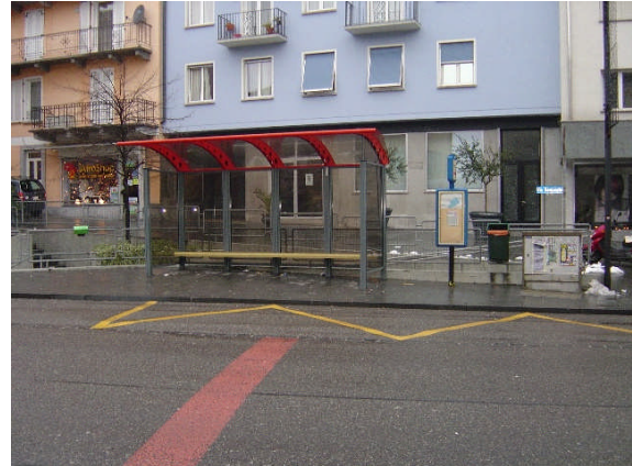
Linea 31, Municipio direzione Locarno