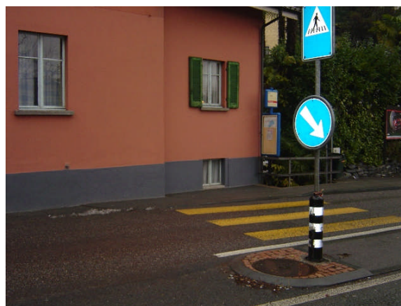
Linea 31, Ignifera direzione Locarno