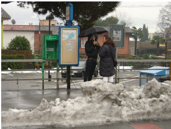
Linea 31, Crocifisso direzione Tenero