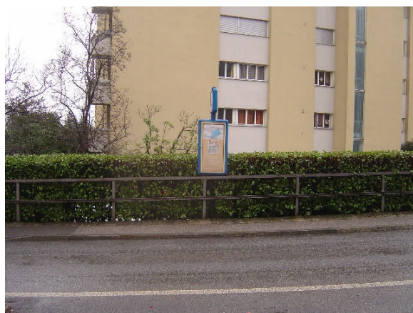
Linea 31, Ignifera direzione Tenero