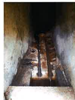
Sorgente Romerio interno