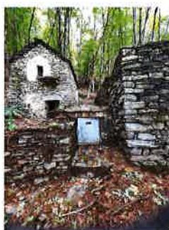
Sorgente Romerio esterno