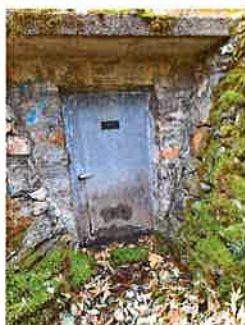
Sorgente Sira esterno