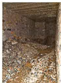
Sorgente Sira interno